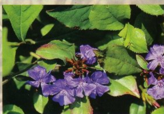
Hat eine Katze zu wenig Selbstvertrauen, kann Cerato (oben) das richtige Mittel sein. Die Apfelblüte (unten) wirkt reinigend, bei Ungeziefer, Infektionen, Zahnstein

● Rescue Remedy , die sogenannten Notfalltropfen: Diese kommen in akuten Situationen zum Einsatz. Bei plötzlichen Erkrankungen, Unfällen, Schockerlebnissen oder abrupten Veränderungen der Lebenssituation.